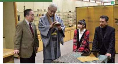
則夫が極渡と柵橋にしてやられるシーンを撮影

8 (株)小森商店 住所:堺区熊野町東 3-2-26 TEL:072-233-3530