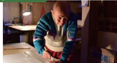
譲り状の材料となる紙を切るよっちゃんの回想シーンを撮影

9 宮川芳文堂 住所:堺区南旅籠町東 1-2-11 TEL:072-238-2256