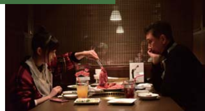
則夫といまりが母親の話をする焼肉屋のシーンを撮影

4 ワンカルビ堺西店 住所:堺区山本町 3-85-1 TEL:072-227-4129