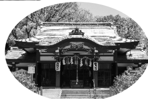
境内に晶子の歌碑がある開口(あくち)神社