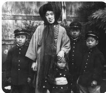
晶子と子どもたち

しているみなさんが、絵を描くことでより深く晶子の短歌を理解 するきっかけになるとともに、素晴らしい歌人を生んだふるさと・ 堺に誇りをもってもらえたら、と思います。