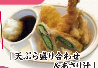
「天ぷら盛り合わせ & あさり汁」