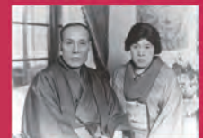
与謝野寛と晶子 自宅にて昭和8年(1933)