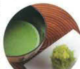
各种体验活动都附赠堺的日式糕点

这里介绍堺市悠久历史文化资源，同时也可在堺市游玩的各位提供本市周边丰富的旅游信息。通过灵活使用触摸屏以及平板电脑，可以向您方便直观地介绍堺市的观光信息和看点。（只有日语解说）