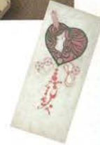
요사노 아키코(與謝野晶子)를 대표하는 "행들어진 머리칼"도 전시되어 있습니다.

아키코의 책은 디자인에 공을 들여 색채가 풍부한 것이 많아서, 미술품으로서도 가치가 높습니다. 그것은 남편 히로시(寛)가 말한 "후세까지 남을 만한 것이어야 한다"라고 하는 소신을 따른 것으로 저명한 화가들이 그린 책 디자인을 한번에 보실 수 있습니다.