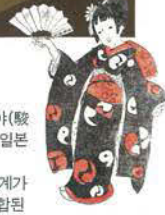
타케사키 유에지(竹久夢二)가 그린 아키코의 소녀시절 일러스트로 연출합니다.

아키코의 생가인 "스루가야(駿河屋)"는 양경으로 유명한 일본 전통 과거점이며, 2층이 서양식으로 만들어져 큰 시계가 있는 일본식과 서양식이 융합된 건물이었습니다. 스루가야를 재현한 전시실은 아키코의 소녀시절을 소개합니다.