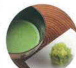
두 가지 체험 다사카이의 화과자(생과자)가 나옵니다.