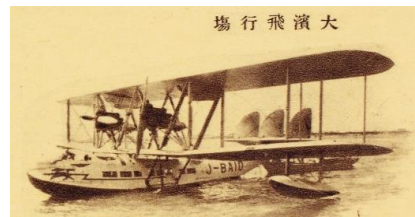
「堺名所絵葉書 第二輯 大浜飛行場」【堺市中央図書館蔵】

堺の大浜にかつて飛行場があったことをご存知でしょうか。およそ、100年前の大正11(1922)年に日本最古の民間航空企業「日本航空輸送研究所」が、大浜に飛行場を開設しました。この講座では、大正15(1926)年に同所が発行した『航空経済の第一声』(堺市博物館蔵)をもとに、堺大浜飛行場と「日本航空輸送研究所」についてご紹介します。