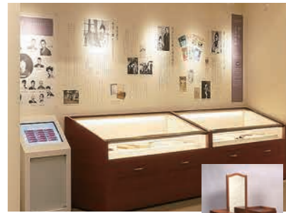
展示晶子生前爱用之物，可以真切感受到当年温暖的生活气息。

晶子成为12个孩子的母亲，直到丈夫宽去世的34年间，夫妻二人始终长厢厮守。宽与晶子夫妻二人亦师亦友，惺惺相惜。至死不渝的爱情和相互尊重信赖的纽带将他们紧紧连在一起。