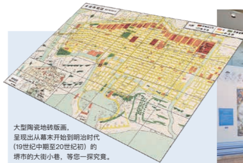
大型陶瓷地砖壁画，呈现出从幕末开始到明治时代（19世纪中期至20世纪初）的堺市的大街小巷，请您一探究竟。

这里介绍堺市悠久历史文化资源，同时也可在堺市游玩的各位提供本市周边丰富的旅游信息。通过灵活使用触摸屏以及平板电脑，可以向您方便直观地介绍堺市的观光信息和看点。（只有日语解说）