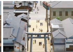
用立体模型与独特的旁白介绍了昭和初期（1920年代末），作为堺中心的宿院（本设施所在地）周边的繁华。（只有日语解说）