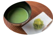
* 各种体验活动都附赠堺的日式糕点